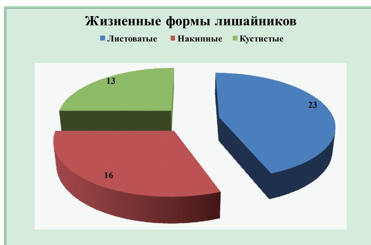
Рис. 4. Соотношение морфологических групп лишайников

Анализ состава жизненных форм показал наличие трех основных морфологических типов лишайников: листоватых (23 вида), накипных (16) и кустистых (13) (рис. 4). Такая картина не типична для нашего региона, в котором в целом преобладают накипные формы. Это связано, прежде всего, с наличием достаточно взрослых хорошо развитых пойменных лесов и сосновых посадок, к которым и приурочена основная масса листоватых и кустистых видов.