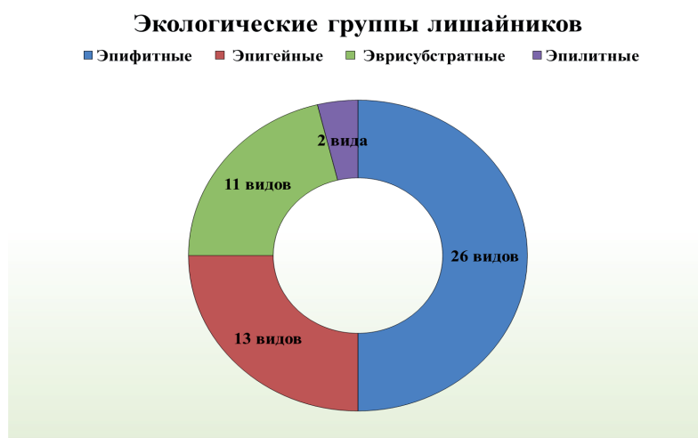
Рис. 3. Соотношение экологических групп лишайников

Мы также проанализировали распределение видов лишайников по экологическим группам по отношению к субстрату (рис. 3). Были выявлены эпифитные, эпигейные, эпилитные и эврисубстратные виды. Преобладающей экологической группой являются эпифиты (26 видов). В меньшей степени распространены эпигейные (13 видов) и эврисубстратные (11) лишайники. Эпилитные лишайники представлены 2 видами, которые растут на мелких известьсодержащих камешках в степи, на шифере и на бетоне. Таким образом, большинство лишайников приурочено к строго определенному типу субстрата.