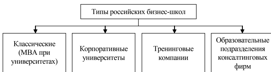
Рис. 1. Типы российских бизнес-школ

Бизнес-образование включает в себя программы послевузовского дополнительного бизнес-образования, тренинги, программы повышения квалификации и профессиональной переподготовки, а также программы MBA. Следует отметить, что подготовка по программам MBA (Executive MBA (EMBA), Full time MBA, Part time MBA, Distance-learning MBA, Mini MBA), как свидетельствует мировая практика, является основной формой бизнес-образования. Субъективное пространство – это идентичность человека в его социокультурном окружении [9, с. 17].