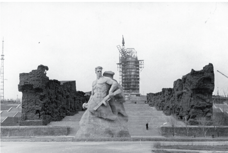
Рис. 3. Финальная стадия сооружения памятника-ансамбля «Героям Сталинградской битвы» на Мамаевом кургане ( http://rusmania.com/perch/resources/construction.jpg ).