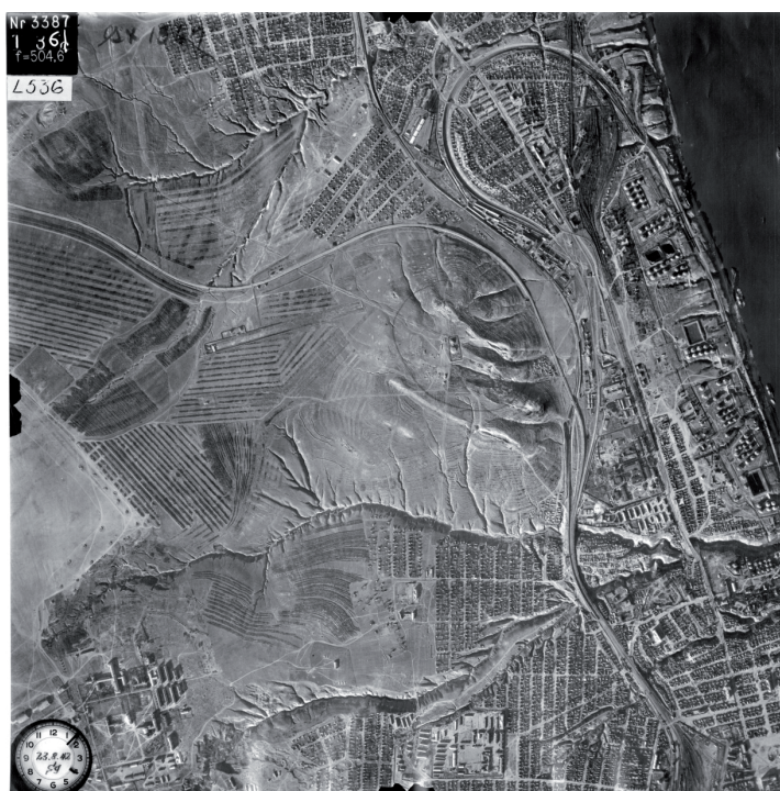
Рис. 1. Немецкий аэроснимок района Мамаева кургана и его окрестностей, август 1942 г. (Из фондов музея-панорамы «Героям Сталинградской битвы»).

До 12 сентября 1942 г. на вершине кургана располагался командный пункт 62-й армии, но после прорыва немецких войск в центр Сталинграда он был перенесен к Волге [1]. В ее береговых обрывах были открыты штольни, в которых располагался штаб 62-й армии, командующий В.И. Чуйков, бойцы и часть санбата. Штольни пройдены в песчано-алевритовой толще эоцена, при этом пласт сливных песчаников служил естественной подошвой блиндажей.