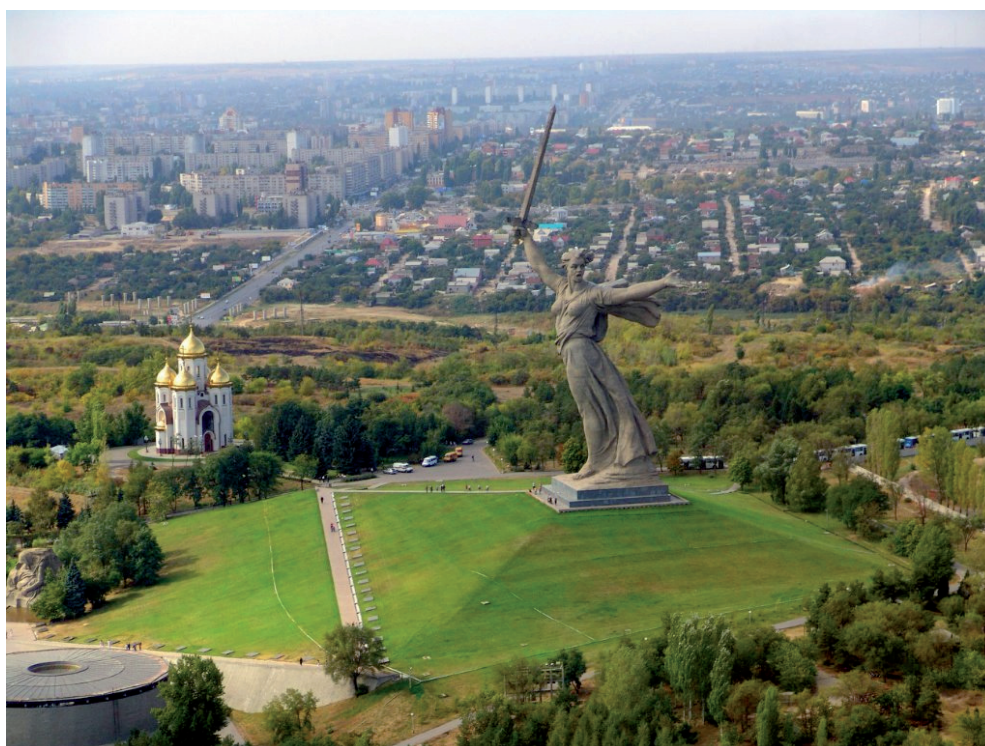
Рис. 4. Современная панорама центральной части Мамаева кургана.

Наряду с мемориальной функцией ландшафт развивается под влиянием хозяйственных функций. Так, восточный склон кургана прорезан железной дорогой Волгоград – Москва, восточнее ее находится проспект Ленина – основная по пассажиропотоку магистраль Волгограда. Западный склон ограничен Второй Продольной – самой длинной улицей города общей протяженностью более 70 км. В восточной части кургана находится ретрансляционная вышка и комплекс зданий телерадиокомпании Волгоград-ТРВ.