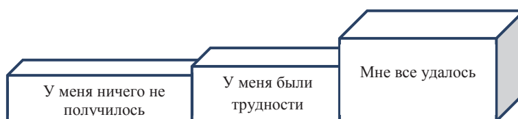
Рис. 2. Прием «Лесенка успеха» (1–2 класс)

Применяется дифференцировано в зависимости от возраста учащихся (количество ступенек увеличивается от класса к классу) (рис. 2, 3).