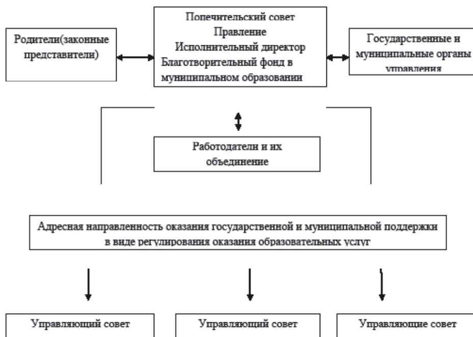
Рис. 3 Государственно-общественное сетевое взаимодействие образовательных организаций в муниципальной сети: субъекты и управление [8; 12]

Поддержание адекватной информационной модели социально-экономического и административного взаимодействия высших учебных заведений и органов публичного управления необходимо для разработки и «реализации управленческих решений» [10, с. 74]. Общая структура государственно-общественного взаимодействия в образовании на муниципальном уровне может быть представлена в следующем виде (рис. 3):