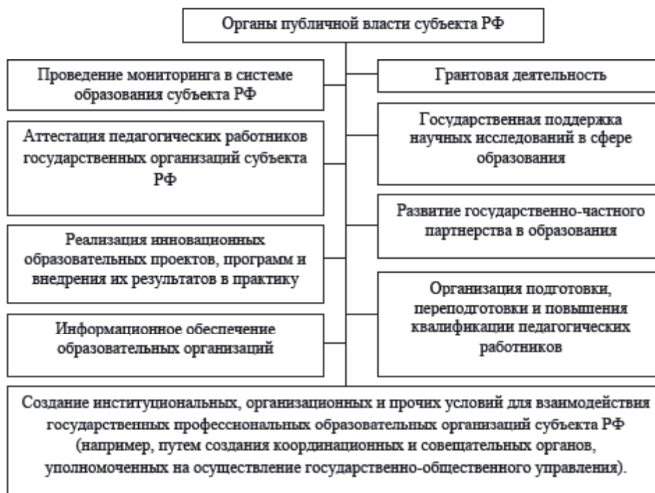
Рис. 2. Модель социально-экономического сотрудничества образовательной организации и органов публичной власти субъектов РФ [5]

Модель социально-экономического сотрудничества образовательной организации и органов публичной власти субъектов РФ также состоит из следующих элементов (рис. 2):