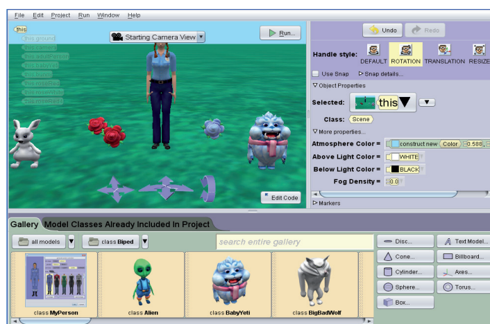
Рис. 1. Выбор объектов в рабочей области Alice

Пример выбора объектов в рабочей области Alice представлен на рис. 1. В данном случае в программе создается виртуальный объектно-ориентированный «мир», где возможно описание каждого объекта, представленного на общей сцене.