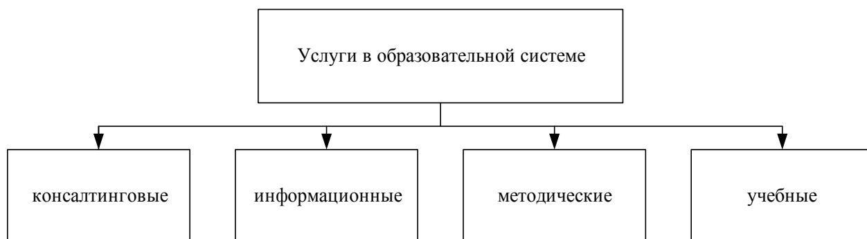
Рис. 1. Виды услуг в образовательной системе [5]

Предпринимательство в образовании связано с деятельностью самих образовательных учреждений, которые оказывают соответствующие их видам деятельности услуги в системе образования. Схематично перечень услуг в образовательной системе можно представить следующим образом, как показано на рис. 1.