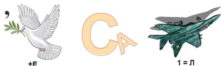
Рис. 2. Ребус «Иерусалим»