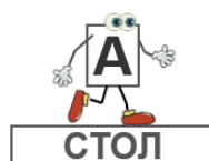
Рис. 3. Ребус «Апостол»

На основном этапе урока, когда происходит первичное усвоение нового материала, применяются игры, иллюстрирующие рассказ учителя или формирующие умения и навыки, например, навык пользования богослужебными книгами.