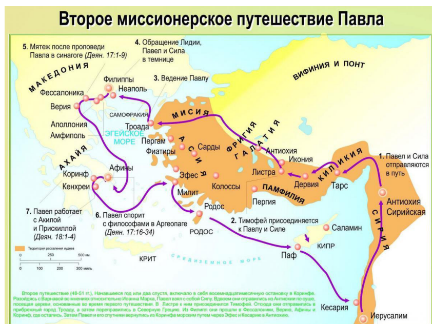
Рис. 5. Второе миссионерское путешествие Павла

На этапе контроля и закрепления полученных знаний применяются игры, ориентированные на формирование умения самостоятельного планирования учебной деятельности. «Самым популярным вариантом реализации этой технологии являются уроки в форме традиционной викторины или её современной вариации – квиза (quiz) с вопросами открытого или закрытого типа. Многочисленные вариации правил проведения такой игры основываются на общеизвестных форматах: «Что? Где?