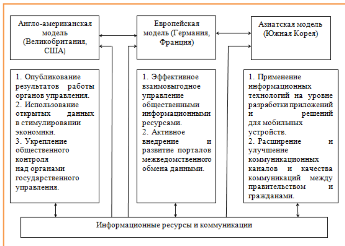
Рис. Модели организации деятельности открытого правительства за рубежом

Специфику и опыт деятельности органов открытого правительства указанных государств можно представить наглядно (см. рис.)