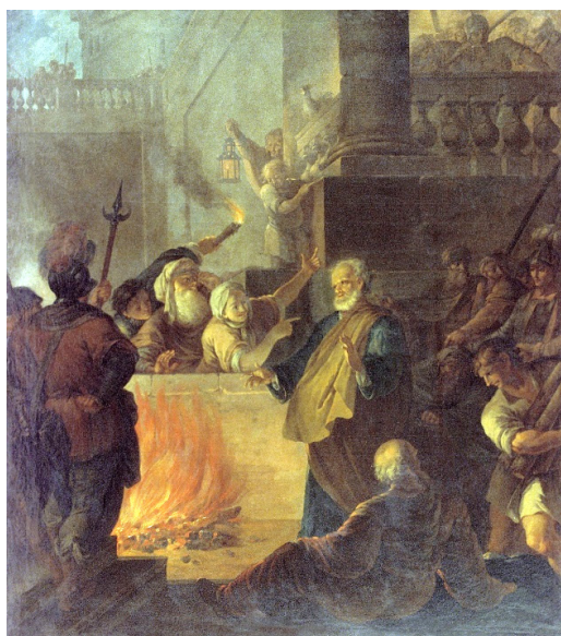
Рис. 2. Г.И. Козлов. Апостол Петр отрекается от Христа. 1762 г. Гос. Русский музей [3]

по схожую тему. «Общее расположение масс, фигура апостола, отступающего от жестикулирующей служанки, лестница с воинами, членение пространства архитектурой на последовательные планы – эти внешние мотивы сходны в работах Козлова и Жака Стелла», – писал А.Н. Савинов. Он также отметил, что несмотря на сопоставимость работ, Г.И. Козлов придал картине собственные художественные особенности [7, с. 165]. Художник усилил динамику в композиции и добавил детали бытового плана. Эта картина стала для Козлова началом его успешной академической карьеры. Также он вел и обширную педагогическую деятельность, под его началом трудилось немало художников конца XVIII столетия.