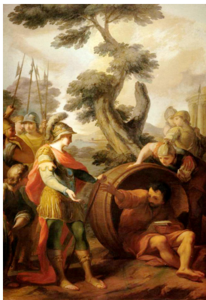
Рис. 1. М.И. Пучинов. Беседа Диогена с Александром Македонским. 1762 год. Гос. Русский музей [3]

Матвей Иванович Пучинов (1716–1797) был историческим живописцем при императорской шпалерной мануфактуре. Признание он получил после создания картины «Беседа Диогена с Александром Македонским» (см. рис. 1). Это творение дает представление о том, какие были исторические картины в первые годы существования Академии художеств. Сюжет картины основан на притче, рассказанной философом Плутархом. Александр Македонский после череды успешных завоевательных сражений ожидал, что все, кто встречался ему на пути, готовы выразить ему свое уважение и почтение, но при встрече с Диогеном все было иначе. Во время разговора с философом Александр не получил должного уважительного обращения. Напротив, философ всячески показывал, что личность полководца ему не только не важна, но даже и не известна. Когда же А. Македонский предложил Диогену исполнить любое желание, философ ответил: «Отойди, ты заслоняешь мне солнце». По своему стилю работа схожа с картиной профессора Академии художеств Л.Ж.Ф. Лагрене-старшего, и во многом саму работу можно рассмотреть, как декоративное панно на историческую тему, но несмотря на декоративность и даже сближение со стилем рококо, эта работа отличалась высоким уровнем профессионализма самого художника, и выражало глубокое понимание темы.