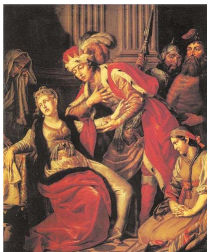
Рис. 4. А.П. Лосенко. Владимир и Рогнеда. 1770 г. Гос. Русский музей [Там же]

Однако настоящий триумф произвела работа «Владимир и Рогнеда», написанная в 1770 г. (см. рис. 4). Эта картина стала новым словом в области исторического жанра, ведь национальное прошлое в ней выдвигалось как явление равноправное античной и библейской тематике. А.Н. Савинов в своем труде точно отметил: «Художник стремился выявить отношения действующих лиц между собой, точно определить значение каждой фигуры в картине. Он оттенил патетические переживания Владимира и Рогнеды тихим отчаянием прислужниц княжны и холодным любопытством воинов <.....> Владимир является носителем противоречивых начал: чувства любви и тиранических побуждений» [7, с. 178]. Это произведение оставило яркий след в русской исторической живописи XVIII в. В картине делалась попытка решить сложные вопросы общественной и личной морали, выражался некий протест против деспотичности князя. Художник сам произвел выбор одного из пяти сюжетов, возможных по заданной ему программе. Впервые с таким драматизмом воплощались в живописи те идеи, которые были уже знакомы обществу по литературным произведениям. После написания этой картины развернулась обширная преподавательская деятельность Лосенко, он стал директором Академии художеств. Специально для учеников им было разработано первое академическое пособие для рисования человеческой фигуры.