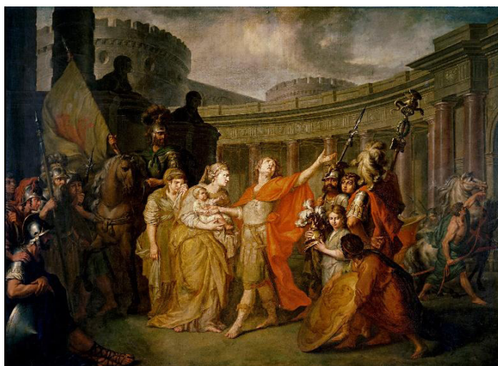
Рис. 5. А.П. Лосенко. Прощание Гектора с Андромахой. 1773 год. Гос. Третьяковская галерея [3]

Последние годы своей жизни А.П. Лосенко работал над картиной «Прощание Гектора с Андромахой» (см. рис. 5), но закончить работу он не успел (в стенах Третьяковской галереи представлен великолепный по живописи эскиз). Сюжет картины взят из поэмы Гомера «Илиада» и представляет эпизод легендарной Троянской войны. Главный герой полотна – Гектор, старший сын троянского царя Приама и его жены Гекубы. Обратившись к античному эпосу, А.П. Лосенко задался целью продемонстрировать проявление силы и красоты человеческих эмоций, что было характерно для творений эпохи классицизма. Действия картины разворачиваются у стен Трои, фигуры размещены на фоне изящной колоннады, которая только усиливает общее героическое звучание картины. Автор вновь соединил величавое и простое, героическое и естественное. Рядом с суровыми воинами он изобразил плачущую служанку, вытирающую слезы, мальчика со шлемом Гектора, засмотревшегося на находящийся рядом щит. Гектор, который прощается с Андромахой и маленьким Астианаксом, представлен в центре композиции и подчиняет себе все окружающие его фигуры.