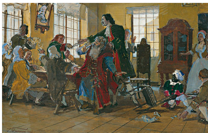
Рис. 5. Д. Белюкин «Петр стришет бороды боярам», 1985 г.

Вероятно, именно знакомство с приведенными источниками послужило вдохновением для создания Д. Белюкиным своей акварели «Петр стришет бороды боярам» (см. рис. 5).