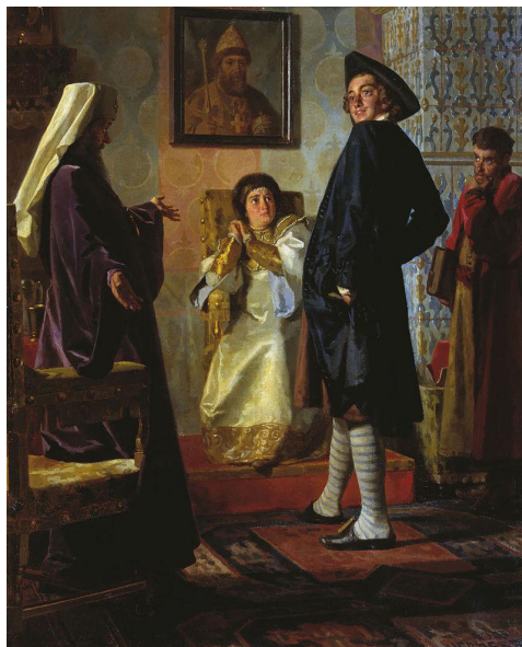
Рис. 4. Н. Неврев «Петр I в иноземном наряде перед матерью своей царицей Натальей, патриархом Андрианом и учителем Зотовым», 1903 г.

Большой интерес как для художников, так и для историков представляют тенденции в моде. Своеобразный крой, узор и рисунок помогают определить период, когда мог носиться костюм, к какому словословию принадлежал его обладатель. Картина Н. Неврева «Петр I в иноземном наряде перед матерью своей царицей Натальей, патриархом Андрианом и учителем Зотовым» показывает нам не только новый костюм, который вскоре будет повелено носить всем, но и реакцию ближнего окружения Петра на него (см. рис. 4).