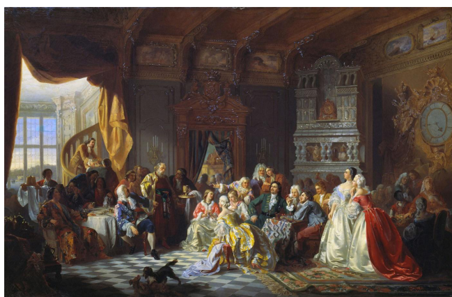
Рис. 1. С. Хлебовский «Ассамблея при Петре I», 1858 г.

Отражает своей кистью ассамблеи и А.И. Перепёлкин, художник XXI в. Картина «Общественная жизнь. Ассамблея при Петре I» переносит нас в настоящий праздник, яркий и веселый, где каждый старается показать не только свои манеры и просвещенность, но и достаток за счет роскошного платья из дорогой ткани и украшений (см. рис. 2 на с. 24). Атмосфера динамичного начала светского вечера передается за счет движения собравшихся. Однако, можно заметить неточность. В объявлении