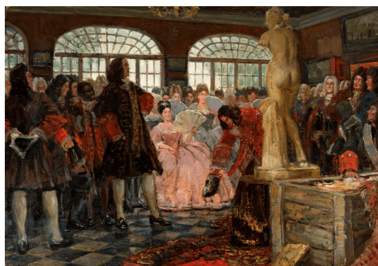
Рис. 9. В. Кучумов «Петр I осматривает статую Венеры в Летнем дворце», 1916 г.

В этой же связи интересной работой представляется картина В. Кучумова «Петр I осматривает статую Венеры в Летнем дворце», на которой изображен момент первого появления на берегах Невы античной статуи Венеры, позже вошедшей в историю национальной культуры под именем Венеры Таврической (см. рис. 9) [10]. Ее запрещено было вывозить из Рима, но отечественный дипломат С. Рагузинский пошел на уловку и предложил папе Клименту IX трофей из Ревеля – мощи святой Бригитты. Папа не мог оставить языческую богиню при себе, когда в предложении фигурировала католическая праведница и в 1718 г. Риму пришлось попрощаться с Венерой. На картине Петр I с торжеством смотрит на мраморную скульптуру. На «презентацию» диковинного приобретения придворные были приглашены в Летний Дворец. Петр I осознавал необходимость развития новой европейской культуры в России. Поэтому следовал своей установке: «Ограждая отечество безопасностью от неприятеля, надлежит стараться находить славу государству через искусства и науки» [21, с. 177]. Венера Таврическая – это первые шаги к возвышению и развитию достижений мирового искусства в России.