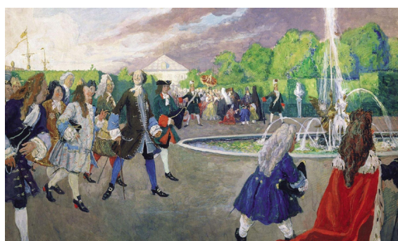
Рис. 8. А. Бенуа «Петр I на прогулке в Летнем саду», 1910 г.

У А. Бенуа в работе «Петр I на прогулке в Летнем саду» мы находим то самое любование Петра оживленным и парадным парковым ансамблем и беззаботное гуляние масс по его территории (см. рис. 8). Летний сад был любимым детищем Петра. Его создание началось в 1704 г. и велось по примеру лучших европейских садово-парковых ансамблей. По задумке Петра I, коллекция мраморной скульптуры, которую можно было разделить на группы исторического, аллегорического и мифологического содержания, должна была способствовать повышению культурного уровня придворных и формированию художественного вкуса у посетителей Летнего сада [13]. По специальному заданию Петра ее закупаали в Италии, чтобы затем установить вдоль аллей, на площадках, у фонтанов.