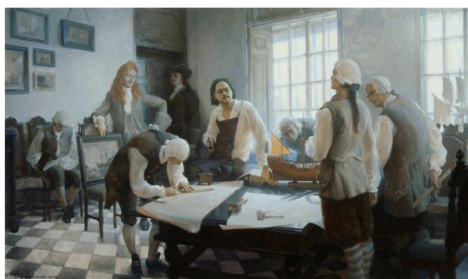
Рис. 7. Ю. Кушевский «Экзамен Петра», 2018 г.

На картине Ю. Кушевского «Экзамен Петра» мы видим схожий сюжет, когда царь лично принимает экзамен у возвратившихся из-за границы молодых дворян, отправленных в Европу для овладения науками (см. рис. 7). Он словно воспроизводит воспоминания адмирала И.И. Неплюева. Свидетельства его ведают нам, что по прибытии в Санкт-Петербург, из коллегии поступил приказ явиться на экзамен. «Мы, собравшись у коллегии, дожидались повеления. В 8 часов государь приехал <...> и сказал нам: «Здорово, ребята». Через некоторое время впустили нас в ассамблею, и генерал-адмирал приказал Змиевичу расспрашивать порознь, кто что знает о навигации. Как дошла моя очередь, то государь изволил подойти ко мне и, не дав Змиевичу делать, спросил: «Всему ли ты научился, для чего был послан?» [16, с. 17].